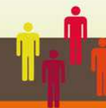
Tableau : Nombre de sociétés coopératives agréées par commission